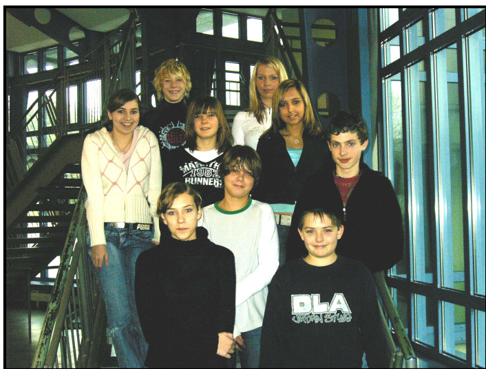
SV-Team und Junior-SV der St. – Ursula Realschule

Wer sind die Schülerinnen und Schüler, die sich in den Pausen und ihrer Freizeit in vielfältiger Art und Weise für ihre Schule und ihre Mitschüler einsetzen?